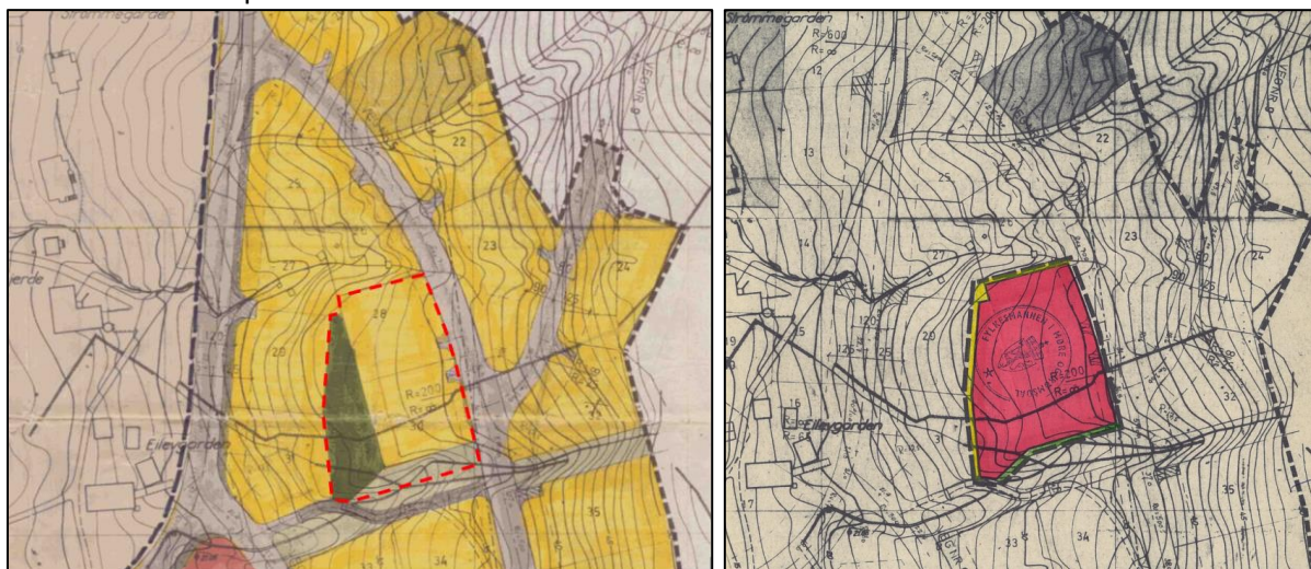
Figur 1 Venstre: Barnehagetomta vist med raud strek i reguleringsplan frå 1977. Det gule er bustadområde og det grønne fellesområde. Høyre: Barnehagetomta regulert til offentleg bygning i reguleringsplanen frå 1979.

Reguleringsplan for Straumgjerde frå 1977 vart endra i 1979 frå bustadområde og fellesareal, til offentleg bygning for å bygge barnehage der. Ved å oppheve reguleringsendringa frå 1979 vil den eldre planen igjen bli gjeldande for området. Det blir då regulert til bustad og fellesareal. I reguleringsplanen frå 1977 består området av 2 tomter (tomt 28 og 30) som det kan byggast ein- og tomannsbustader på.