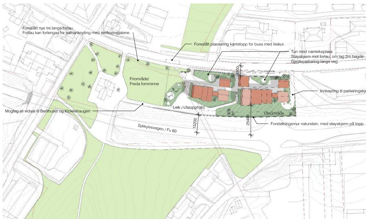
UNDER: Planforslag, 1:2000