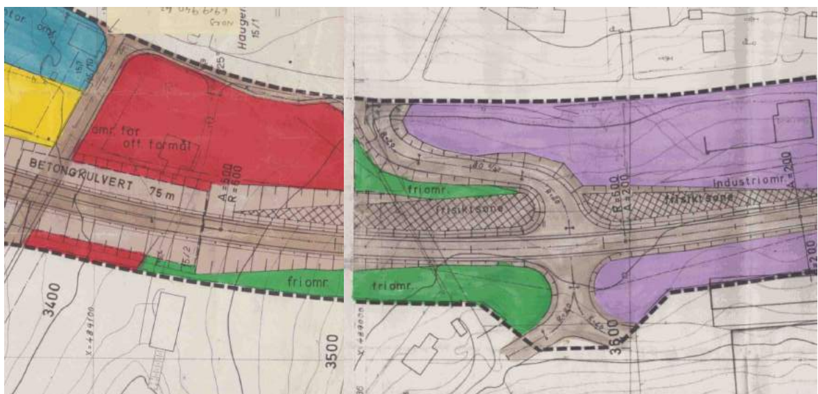
UNDER: Reguleringsplan for ny RV 60, parsell Aure Bru-Tynes (1980), M 1:2000 (Nord mot venstre)