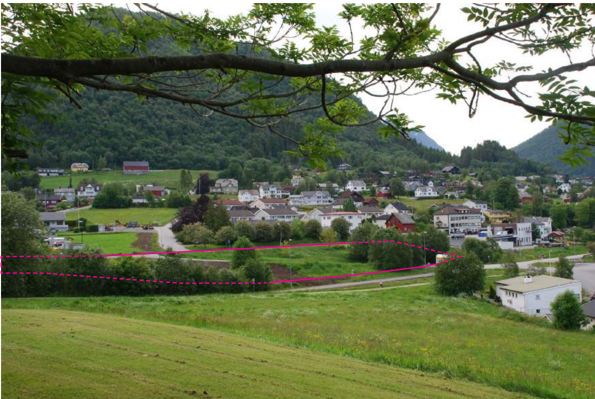
UNDER: Foto av planområdet, sett frå Klokkehaug.

Aust for Kyrkjevegen grenser planområdet mot bustadområde med hovudsakleg einbustadar og eit område som i dag er i bruk som parkeringsplass for Klokkehaug Maskin AS.