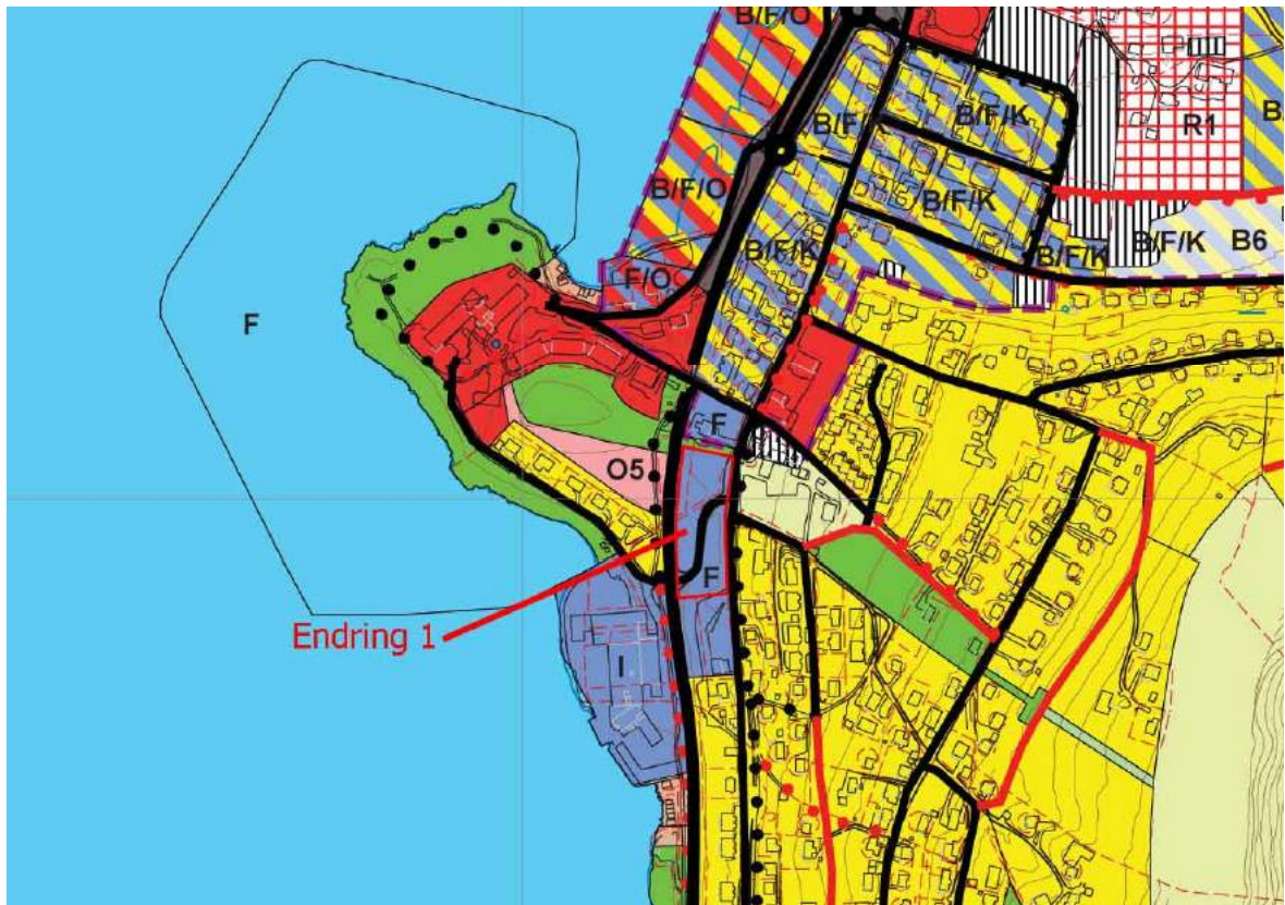
OVER: Kommunedelplan for utvida sentrumsområde 2010-2020, M 1:8000. Merknaden "Endring 01" i plankartet referer til vedtak om endring av formål til "bustad/forretning".