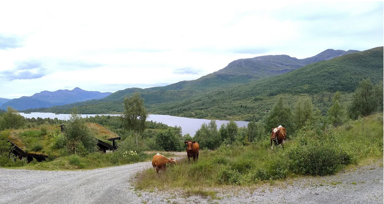
Kyr på utmarksbeite.

Du kan sende inn oppmoding om utbetaling digitalt via Altinn. Logg deg inn i Altinn. Vel kven du representerer (føretak eller privatperson), Vel «Alle skjema» og søk fram skjemaet som du skal registrere utbetalingsoppmoding for. Vel «Starte teneste» og eventuelt «Vidare». Klikk på den blå knappen «Registrer utbetalingsoppmoding» under søknaden. Har du problem med å registrere utbetalingsoppmodinga, ta kontakt med kommunen.