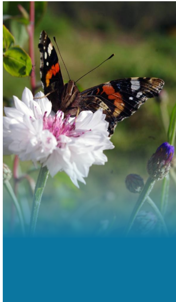
Admiral på kornblomst.

Seterdrifta har lange tradisjonar i Norge. Tidlegare var det naudsynt å utnytte utmarksbeitene til dyrefôr, og mjølka som vart produsert på setrene vart foredla till ost og smør. Endra driftsformer har ført til at tal setre i kommunen har gått sterkt tilbake sidan starten av 1900- talet, og i 2024 var det berre 3 aktive setre igjen i kommunen. Areal som tidlegare var opne er i ferd med å gro igjen og verdifull bygningsarv og kunnskap er i ferd med å gå tapt. Dersom vi ønskjer å ta vare på kunnskapen og kulturarven trengjer seterdrifta eit løft no.