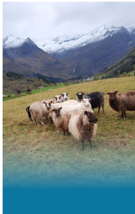
Sau på beite i Velledalen.

På fjellet kan det også vere dårleg dekning for mobilsignal, som gjer at sporingssystem (f.eks. radiobjøller) på dyra ikkje alltid verkar så godt. Sankekve og gode sperregjerde gjer bruken enklare, og bruer og drifteveggar lettar tilsyn på utmarksbeite.