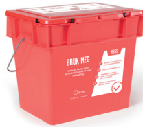
Ein boks til å samle miljøfarleg avfall i.