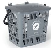
Matkorg til å samle matavfall i inne.