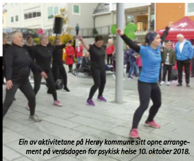
Ein av aktivitetane på Herøy kommune sitt opne arrangement på verdsdagen for psykisk helse 10. oktober 2018.