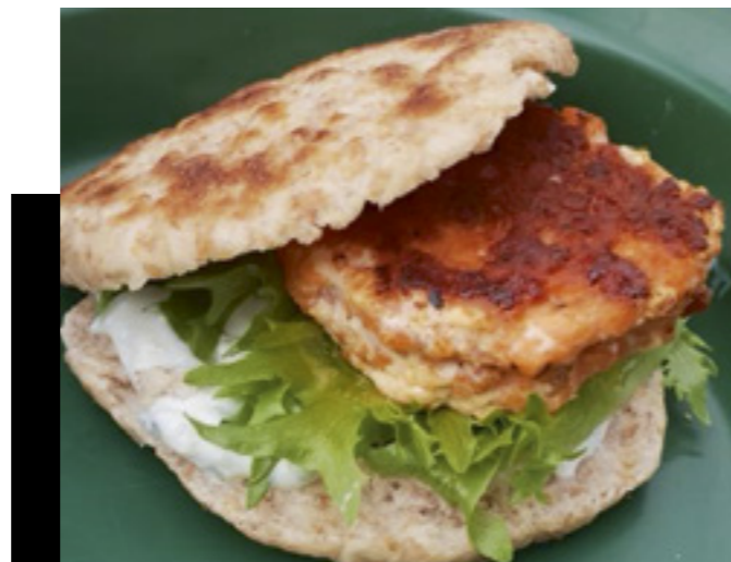
Naturbarnehage – frå fiskesprellkurser – fiskeburger – nam!