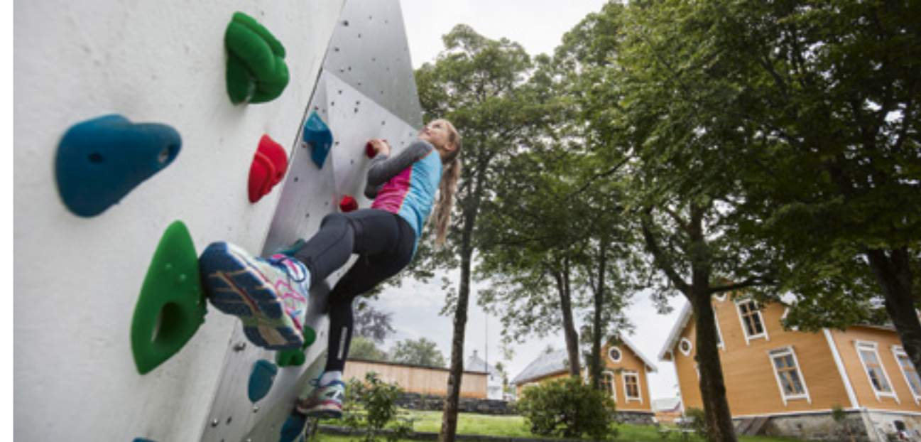
Svendsenhagen i Ørsta sentrum med buldrevegg