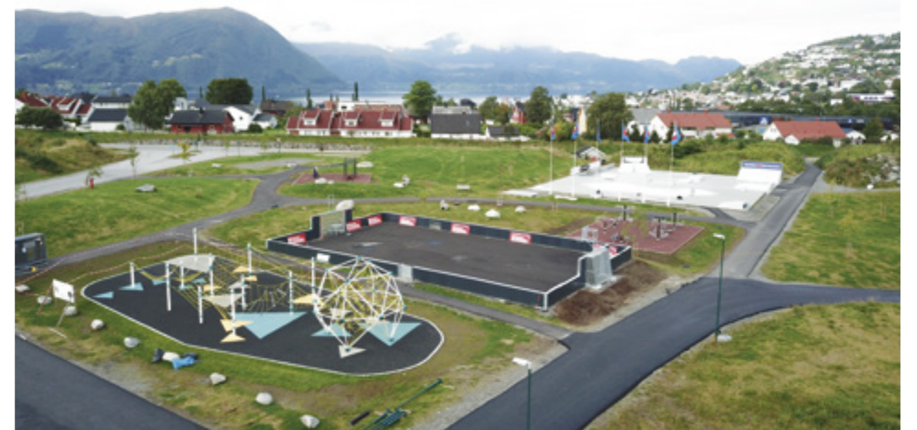
Stadionparken inneholdt ulike treningsapparat, ballbinge, klatrepark, skatepark, sykkel- og turvegar, lysanlegg og sitjeplassar.