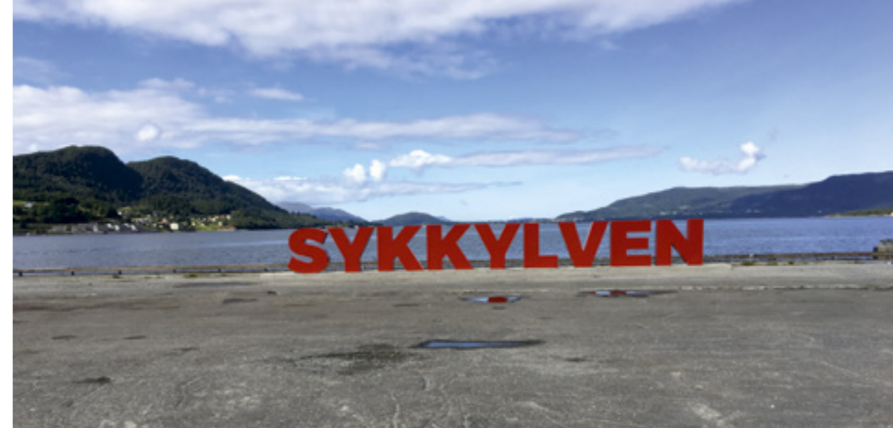
Kaia i Sykkylven.