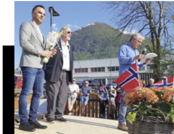
Åpning av ny tursti gjennom Elvadalen