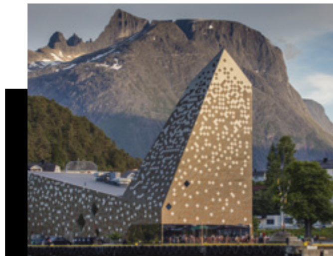
Tindesenteret og sentrum av Åndalsnes.