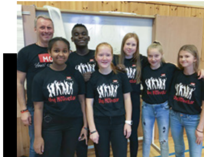
Seminar for ungeMOTivatorer i Tingvollvågen.