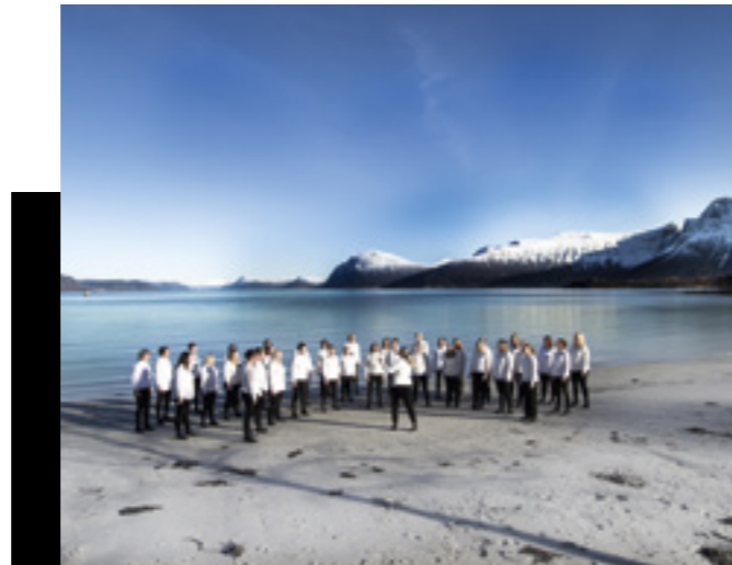
Korsong på Overåsanden.