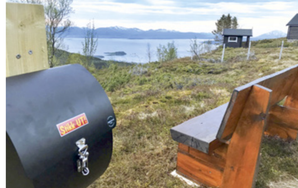
Stikk UT Salthammrsetra.