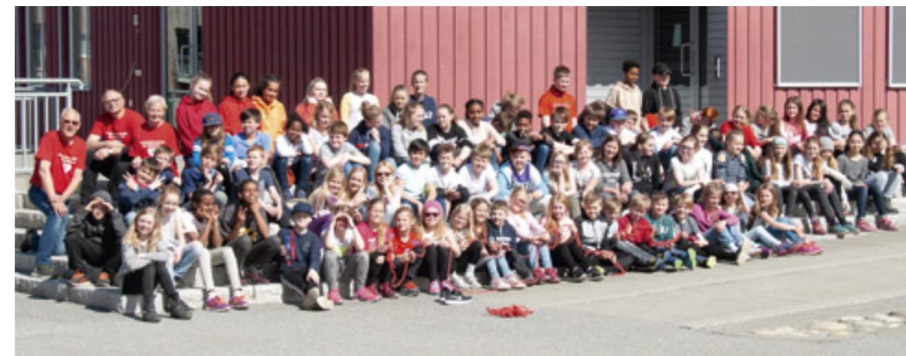
Aure barne- og ungdomsskole 5.-7. klasse under hoppetauaksjonen "Hopp for hjertet".