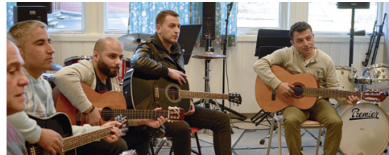
Gitargruppa i tett samspel.