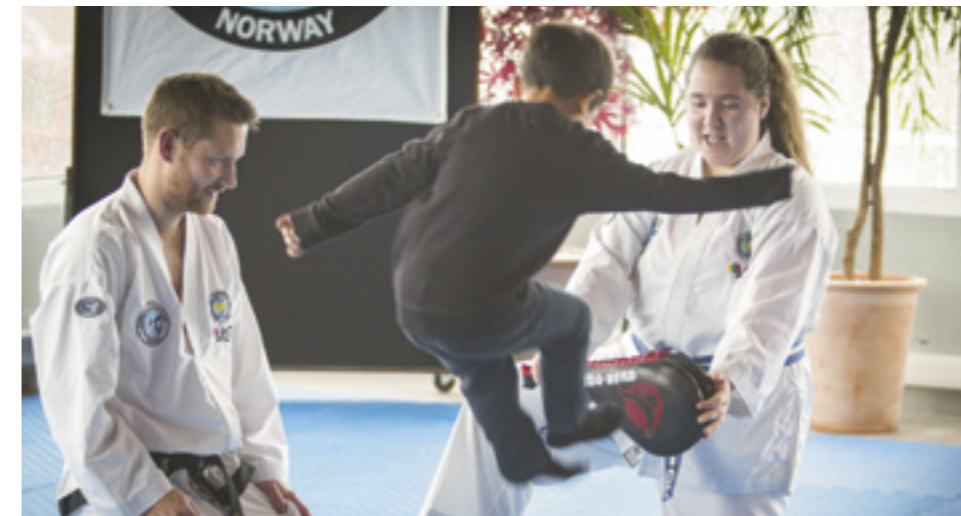
Frå kulturdagen i Giske kommune, september 2018. Ein spennande dag kor mange av innbyggjarane i kommunen deltok og var innom på besøk!