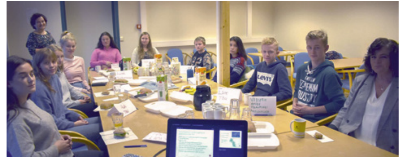
Tingvoll ungdomsråd 2018/19.