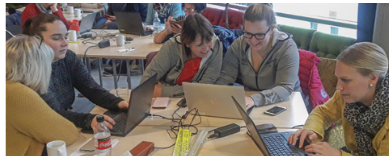
Friskus møte for tilsette november 2018.