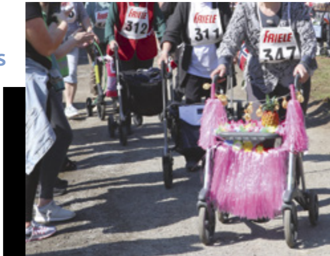
Fra markeringen av Verdens aktivitetsdag: Rullator stafett.