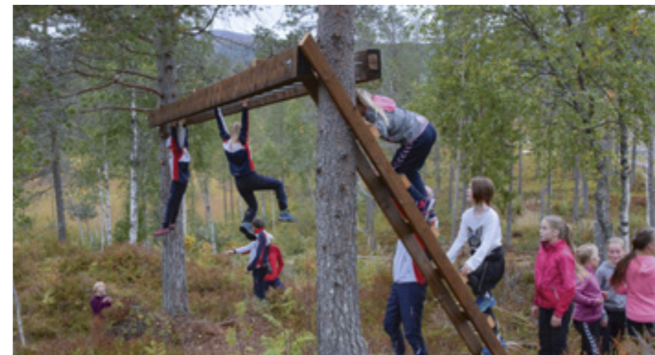
Igljtjønnå aktivitetsløype ble offisielt åpnet i september 2018. Her er ungene i full sving med å teste ut løypa!