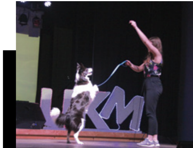
UKM Eide 2018.