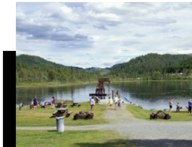
Tjønnå i Rindal sentrum.