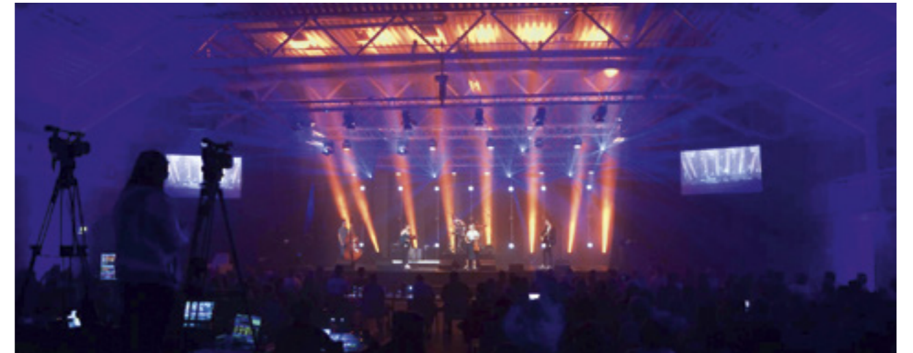
Stordal var vertskommune for UKM Fylkesfestival i Møre og Romsdal i 2018, der 400 ungdommar frå heile fylket representerte sine kommunar med ulike kunstuttrykk.