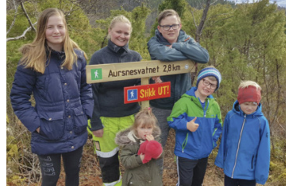
Ein flott dagnadsgjeng som har stått på for å få alt klart til vår første sesong med StikkUT!