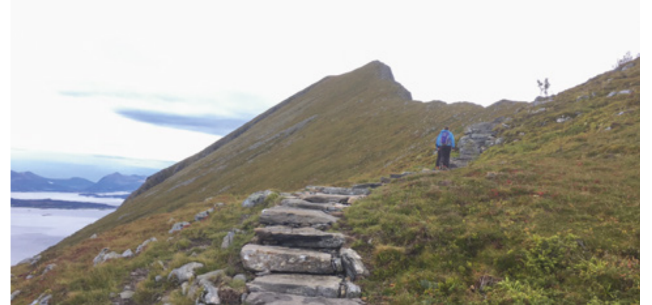
Midsundtrappene mot Rørsethornet 729 moh.