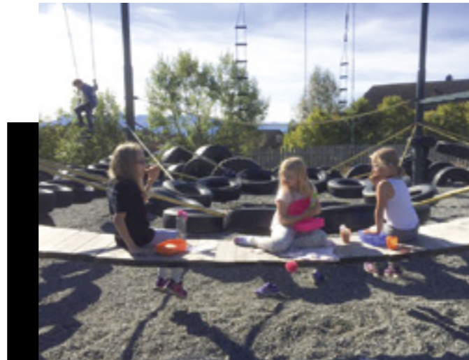
Uteområdet ved Nordbyen skole.