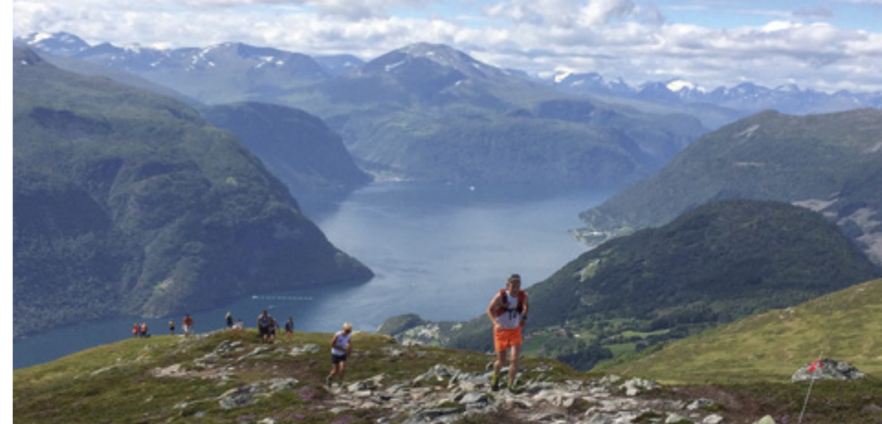
Motbakkeløpet Mefjellet Opp.