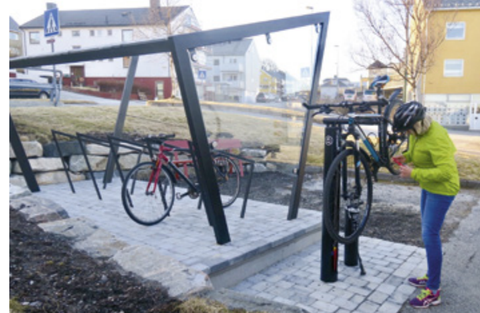
Det ble etablert sykkel-parkering under tak med sørvisstasjon ved alle Sundbåtkaier i Kristiansund.