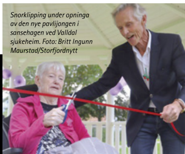
Snorklipping under opninga av den nye paviljongen i sansehagen ved Valldal sjukeheim.