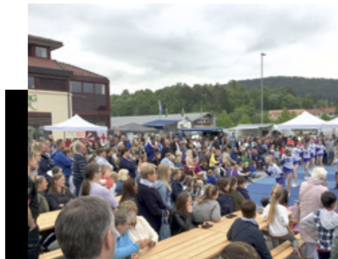
Mykje folk på Ørskogdagen.