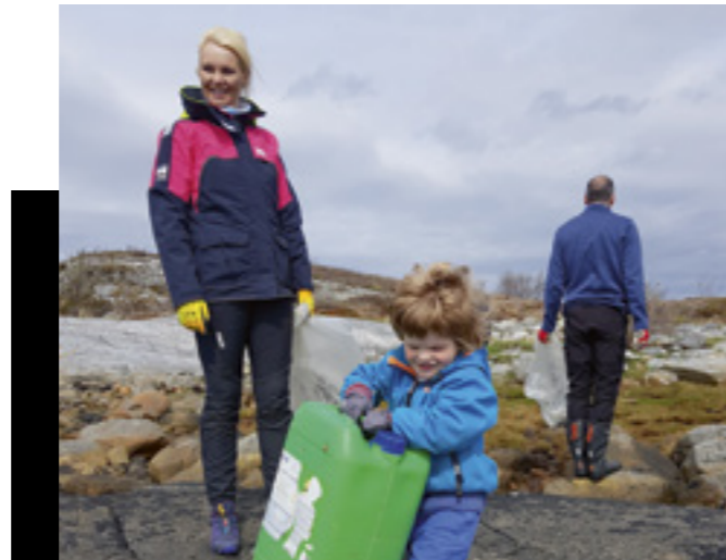
Kampen mot marin forurensning er eit viktig arbeidsområde for friluftsrådet. Samarbeidet med frivillige er avgjerande, og både store og små kan gjere ein innsats.