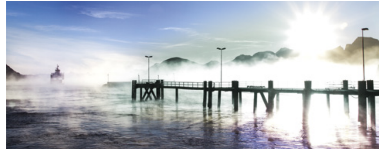
Morgonsol over Hareid.