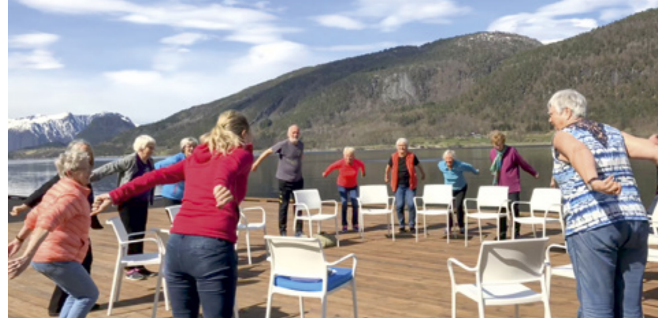
Fra Sterk og stødig treningen på bryggekanalen ved Helsehuset.