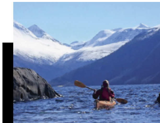
Kajakkpaddling med Skjorta (1 711) i sikte.