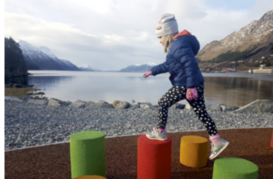
Trim og leik for alle på Måsøyra aktivitetspark