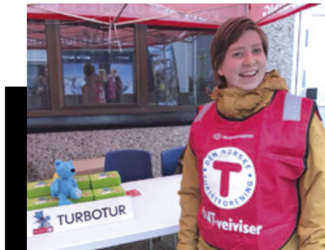
Barnas Turlag vart etablert i Vestnes i 2018.