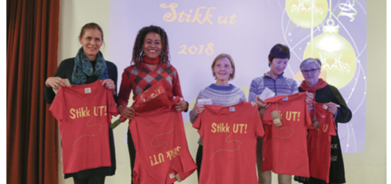
Vinnere av StikkUt! bedrift-prisen 2018.