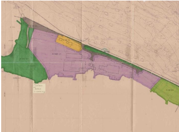
Utsnitt fra reguleringsplan plan Aursnes nedre (1975)

Planområdet omfattes av to eldre reguleringsplaner. Begge planene legger til rette for industri/næring i området. I reguleringsplanen fra 1975 er det et gult felt for boligbebyggelse.