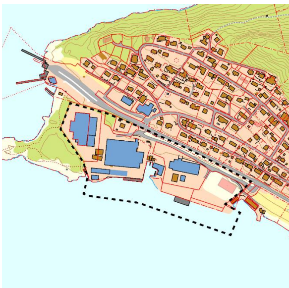
Planområdet med omtrentlig planavgrensning